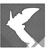
TAVOLA E2 PIANIFICAZIONE TERRITORIALE ED URBANISTICA Scala 1:5000 - Regolamento Urbanistico - AMBITO URBANO Data Mar 2016 CARTA INDAGINI