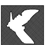
TAVOLA D PIANIFICAZIONE TERRITORIALE ED URBANISTICA

- Regolamento Urbanistico - ZONA D7 - ZONA D9