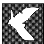
TAVOLA E PIANIFICAZIONE TERRITORIALE ED URBANISTICA

- Regolamento Urbanistico - ZONA ARTIGIANALE D1