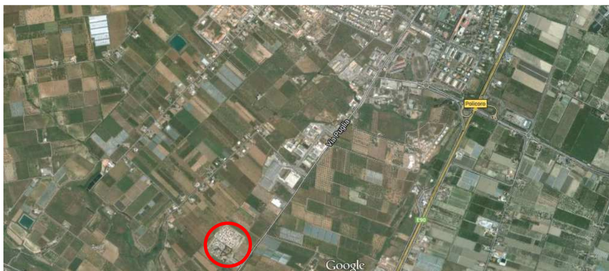
Fig. 1. Inquadramento territoriale tratto da Google Earth

Il cimitero comunale di Policoro è ubicato lungo via Puglia, a circa 2 chilometri a sud rispetto al centro cittadino. Si estende su un lotto di terreno prevalentemente pianeggiante per una superficie di circa 37.000 metri quadrati.