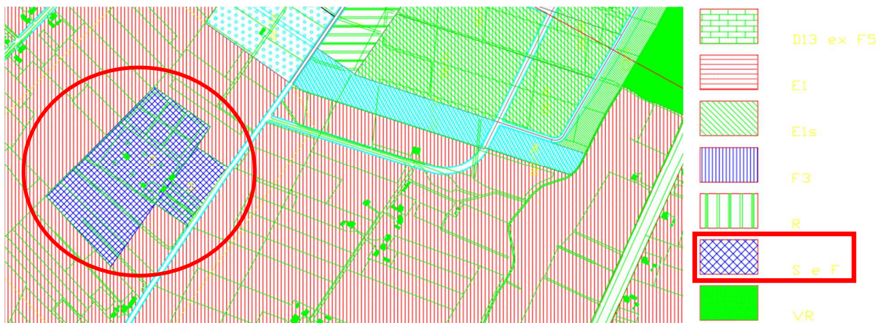
Fig. 3. Stralcio della Tavola della Zonizzazione Urbana

L'area, altresì, ricade nel P.R.G. vigente in zona F4 "Zone cimiteriali e relativa area di rispetto".