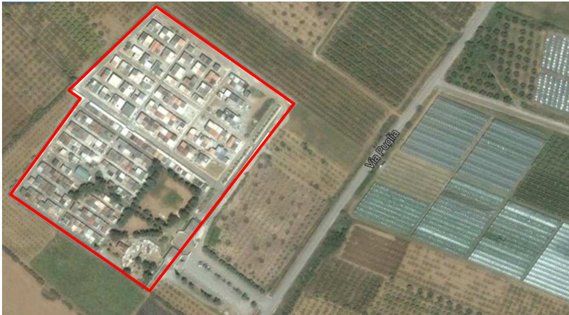
Fig. 2. Inquadramento territoriale

L'area, altresì, ricade nel P.R.G. vigente in zona F4 "Zone cimiteriali e relativa area di rispetto".