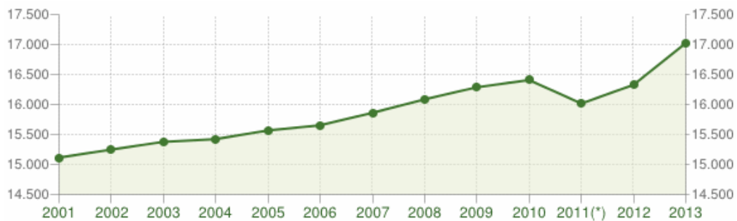
Fig. 5. Andamento della popolazione residente

Anche il comportamento migratorio della popolazione registra un andamento in positivo, in linea con la crescita della popolazione residente, a dimostrazione del fatto che il Comune di Policoro è una realtà in espansione.