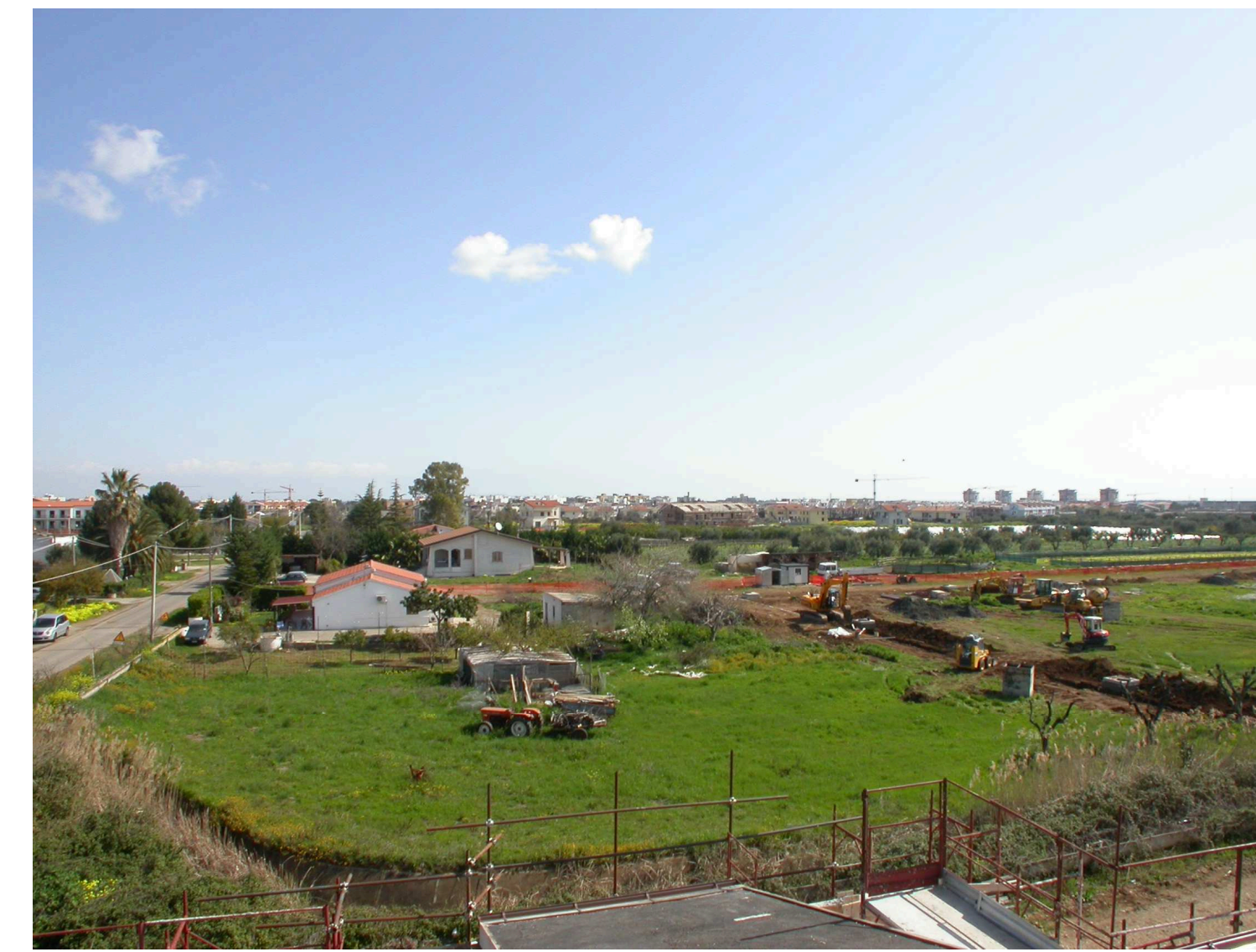
PRESA FOTOGRAFICA PUNTO D