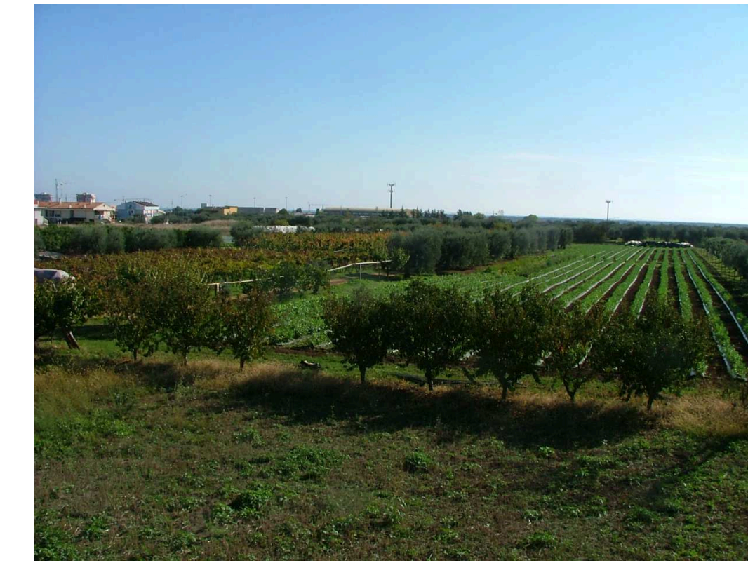
PRESA FOTOGRAFICA PUNTO A