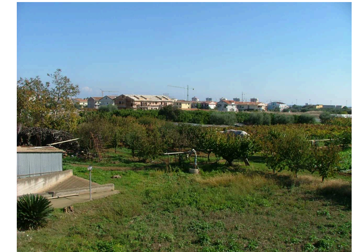
PRESA FOTOGRAFICA PUNTO B